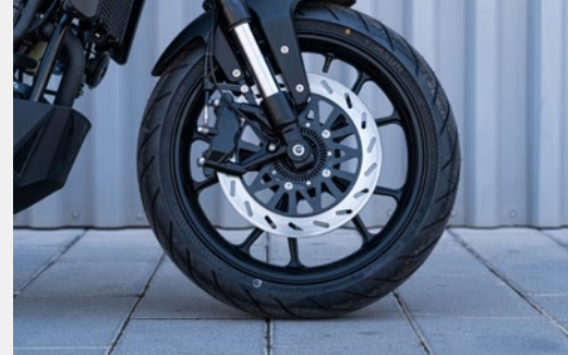
➤ Forcella a steli rovesciati