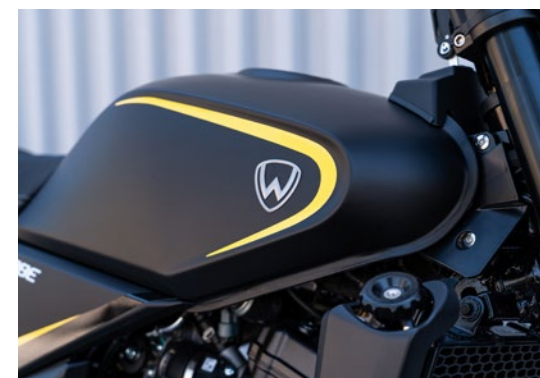
➤ Serbatoio di grande capacità