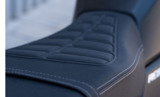
➤ Sella ergonomica