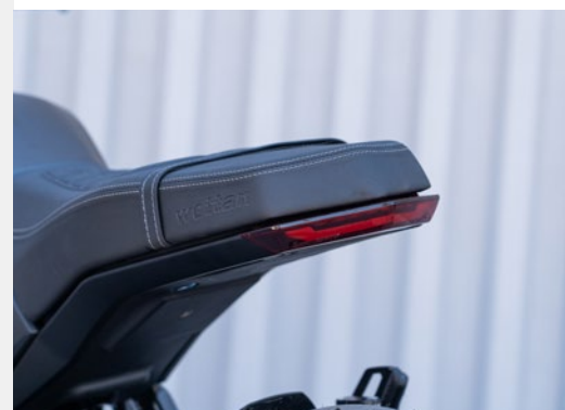
➤ Gruppo luci a LED