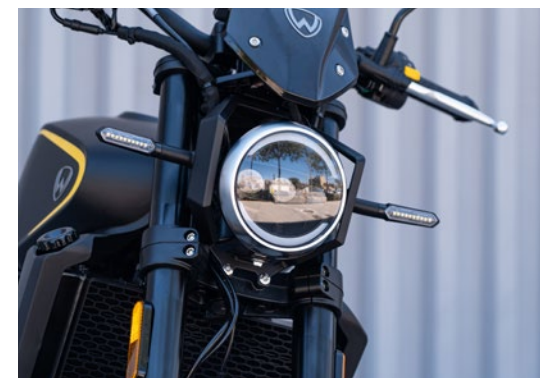
➤ Ottica frontale FULL LED