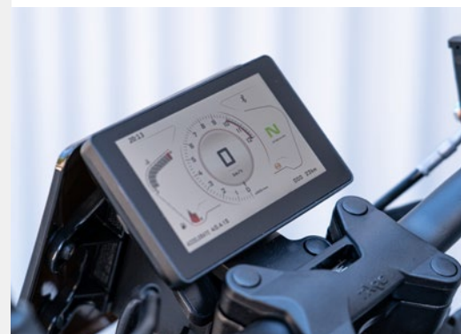
➤ Display TFT con Bluetooth